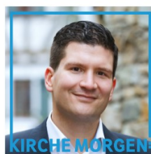
Maximilian Neumann Regierungsrat